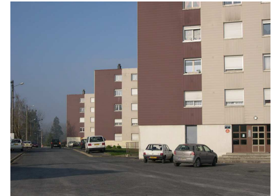
Les Bas Loriots

Classification DPE avant et après travaux : F>B et C selon les bâtiments.