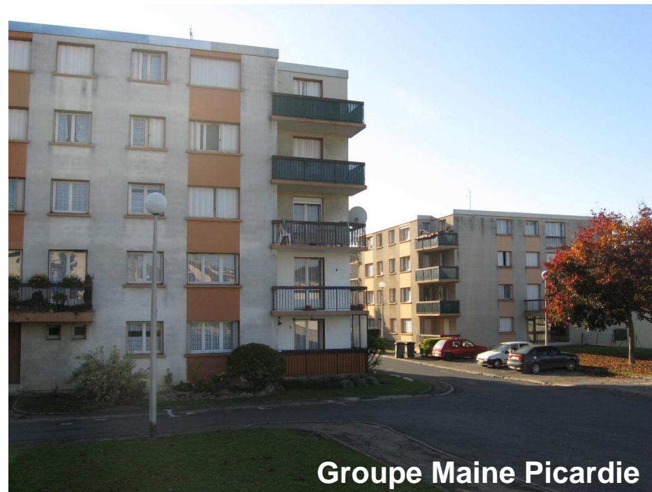
Groupe Maine Picardie

Classification DPE avant et après travaux : F>C.