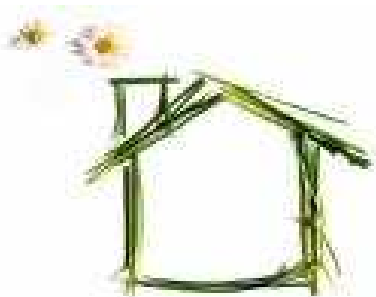
Tours sur Marne